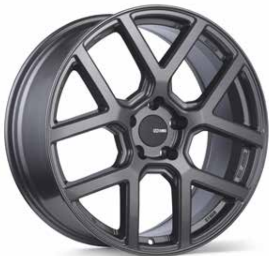
Gloss Gunmetal (GMH)