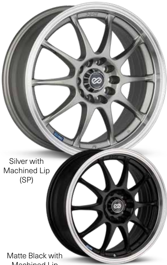
Silver with Machined Lip (SP)