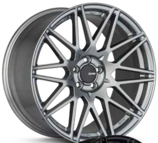
Storm Gray (GR)