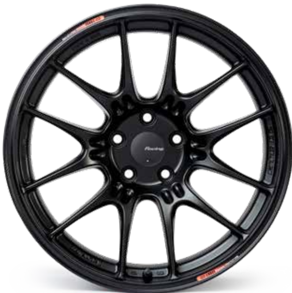
Matte Black (BK)

Visit Enkei.com for cap part numbers Each GTC02 includes two Racing Prototype stickers Valve Stem# V429-0000SP for Hyper Silver, V429-0000BK for Black