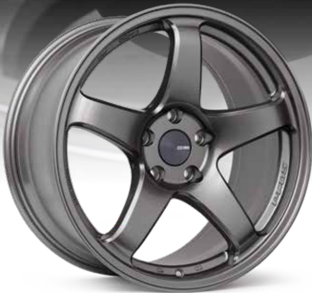
Dark Silver (DS)