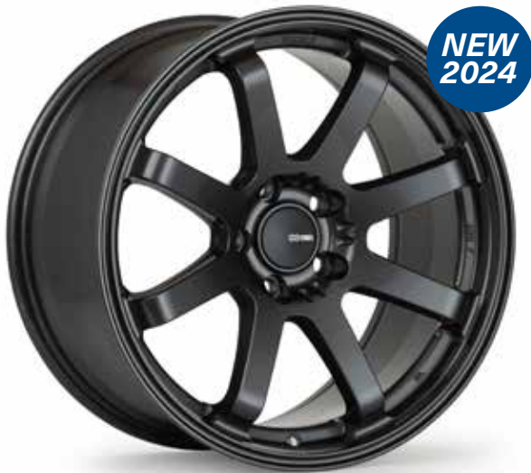
Gloss Gunmetal (GM)

Enkei a développé un nouveau procédé de fabrication pour produire la prochaine génération de jantes en aluminium. La "Most Advanced Technology" (MAT), qui signifie "la technologie la plus avancée", combine la technologie de roue moulée d'une seule pièce avec une technique de "repoussage" de la jante. L'utilisation de cette nouvelle technologie de moulage et de formage de la jante, le procédé MAT, est essentielle pour améliorer radicalement les propriétés matérielles et la résistance des roues. En outre, la technologie de laminage de la jante d'Enkei façonne la jante pour améliorer l'allongement du matériau sans sacrifier la dureté de la roue.