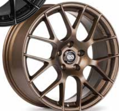
Matte Bronze (BP)