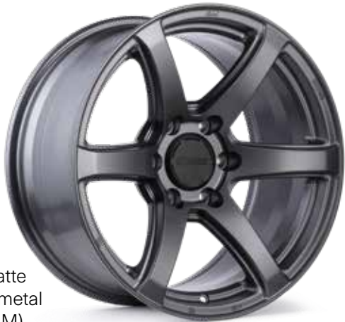
Matte Gunmetal (GM)

Voici la série pour camions d'Enkei. Bien qu'Enkei soit surtout reconnu pour ses roues de voiture haute performance, il est fier de proposer une gamme de roues conçues pour les camions et les VUS. Enkei a mis en œuvre ses capacités d'ingénierie inégalées pour concevoir plusieurs modèles qui répondront aux exigences élevées que les conducteurs de camions et de VUS imposent à leurs roues. En utilisant les installations de fabrication de classe mondiale d'Enkei et en mettant l'accent sur la fonction plutôt que sur l'apparence, la série pour camions d'Enkei offre un excellent moyen pour les propriétaires de camions et de VUS d'ajouter un peu de style à leur véhicule, tout en conservant la résistance et la robustesse nécessaires aux roues de leurs véhicules.