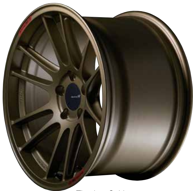
Titanium Gold (Limited Sizes / Special Order)