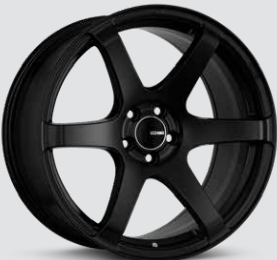
Matte Black (BK)