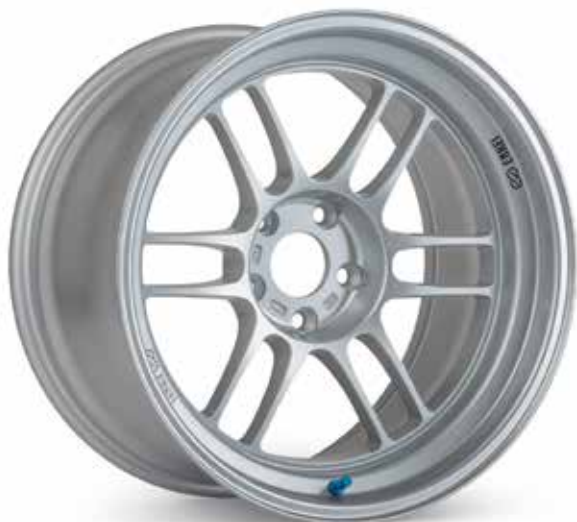
F1 Silver (SP)

La jante RPF1RS offre tout ce que vous aimez de la jante RPF1, mais avec une face profonde créant un large rebord. La jante RPF1RS, fabriquée au Japon, a nécessité plusieurs années de développement. Chez Enkei, nous voulions nous assurer de créer une jante RPF1 à « large rebord » qui est à la hauteur de la solide qualité structurelle que vous attendez de nous. Cette jante est offerte avec des déports faibles et même avec un déport négatif pour la version de 11 pouces de large.