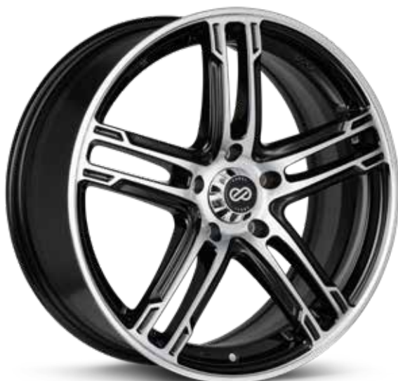
Black Machined (BKM)