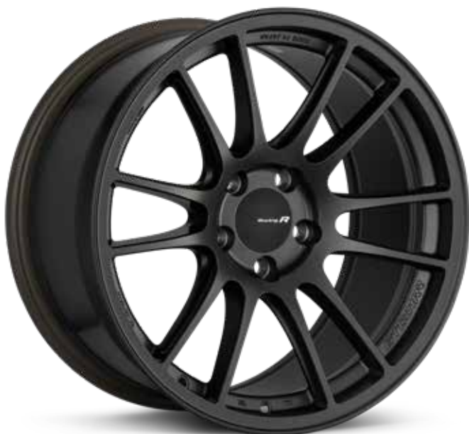
Matte Gunmetal (GM)

La GTC01RR est conçue d'après l'une de nos roues les plus solides, la GTC01. Après maintes recherches, nous avons pu conserver sa grande rigidité tout en la rendant légère, comparable à la RPF1. La GTC01RR a été testée dans diverses conditions de conduite de haute performance, notamment dans les virages, au freinage, à l'accélération, à la décélération et à la réponse de la direction. La GTC01RR est offerte en trois faces concaves différentes, comme indiqué ci-dessous.