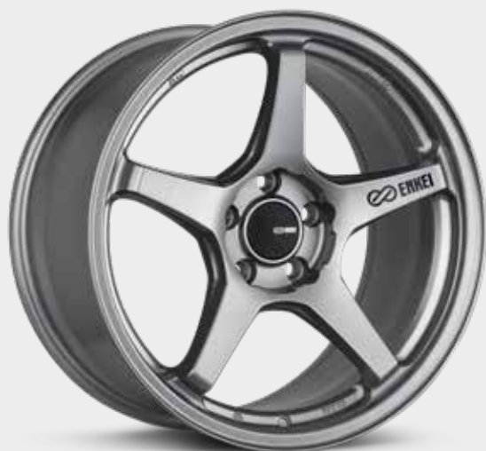
Storm Gray (GR)

La légère TS-5 d'Enkei est sûre de devenir un classique instantané dans le monde de la personnalisation. Tous ceux qui admireront la TS-5 en resteront bouche bée, car elle fait tout et elle le fait bien. Elle est remarquablement simple et propre, s'appuyant sur la formule éprouvée de cinq rayons et d'une lèvre, mais la TS-5 a une esthétique parfaite. C'est le nombre d'or sous forme de roue. Elle évoque à la fois le sport motorisé et la classe. Elle est aussi à l'aise sur une piste que dans la rue. Avec des dimensions de 17 et 18 po et des largeurs allant jusqu'à 9,5 po, la TS-5 conviendra à une variété remarquable de berlines et de coupés sport.