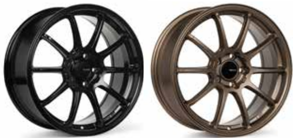
Gloss Black (BK)