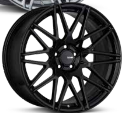
Gloss Black (BK)