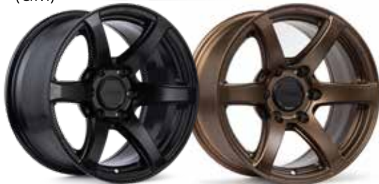
Matte Black (BK)