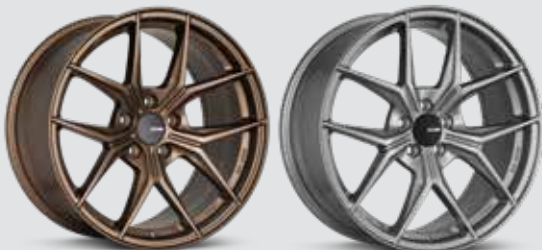
Gloss Bronze (ZP)