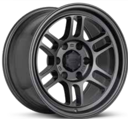
17x9 w/cap Matte Dark Gunmetal (GM)