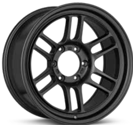
Matte Dark Gunmetal (GM)

La RPF1 d'Enkei fût lancée en 2002 au niveau mondial. Elle a connu un succès immédiat grâce à sa haute résistance, son faible poids et son design sans fantaisies. Les propriétaires de camions et de VUS ont souvent demandé à Enkei de développer une roue RPF1 conçue spécifiquement pour eux et nous avons écouté. La toute nouvelle RPT1 d'Enkei présente le même design épuré à rayons divisés que la RPF1, mais elle est construite pour offrir des capacités de charge plus élevées pour convenir aux camions et aux VUS à six goujons. Elles sont offertes en modèles de 16, 17 et 18 po et dans une variété de couleurs. La RPT1 est l'une des roues de camion les plus légères et les plus résistantes du marché actuel.