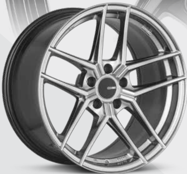
Hyper Silver (HS)

La TY-5 d'Enkei est une entrée excitante dans la série de performance légère d'Enkei. Elle propose une combinaison élégante d'un style à cinq rayons divisés avec les éléments de style centraux d'une roue à rayons croisés. La TY-5 est un excellent choix pour une grande variété de véhicules, des petits coupés sport aux voitures de luxe de grande taille. Elle est offerte en plusieurs couleurs attrayantes, dont l'hyper noir, le noir brillant et un tout nouveau noir nacré limité. La TY-5 est offerte en profils concaves et plats selon la taille et la largeur, et comprend le chapeau de roue central plat caractéristique d'Enkei.