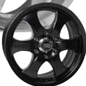
Matte Black (BK)