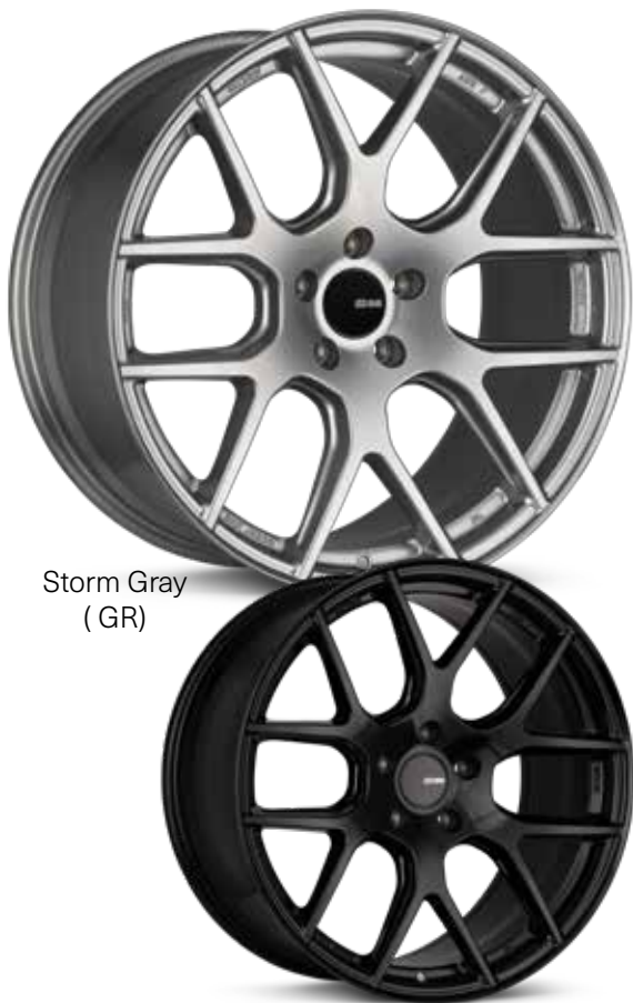
Storm Gray (GR)