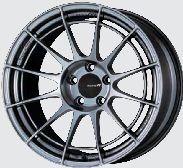
Hyper Silver (Limited Sizes / Special Order)