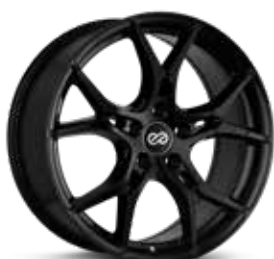
Gloss Black (BK)