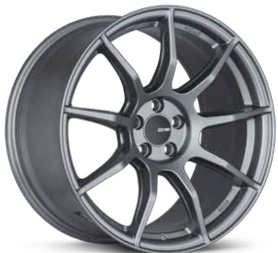
Platinum Gray (GR)