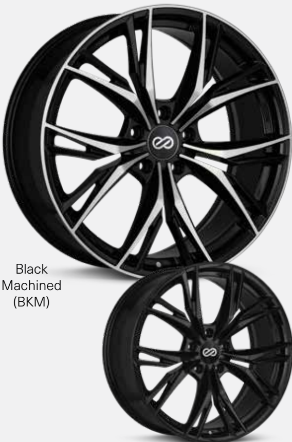
Black Machined (BKM)