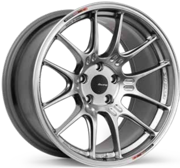
Hyper Silver (HS)