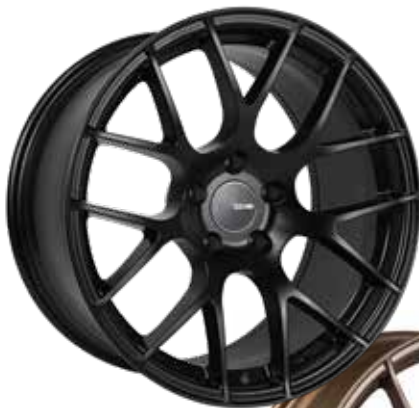
Matte Black (BK) (Shown with optional flat cap)