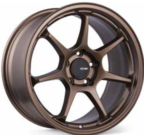
Matte Bronze (ZP)