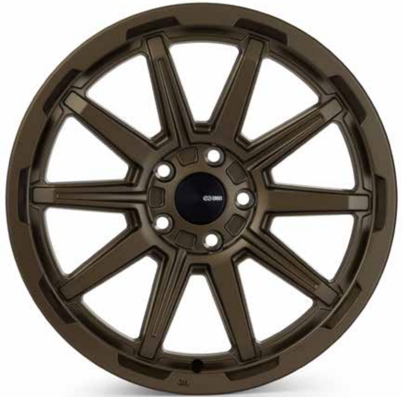
Matte Bronze (ZP)