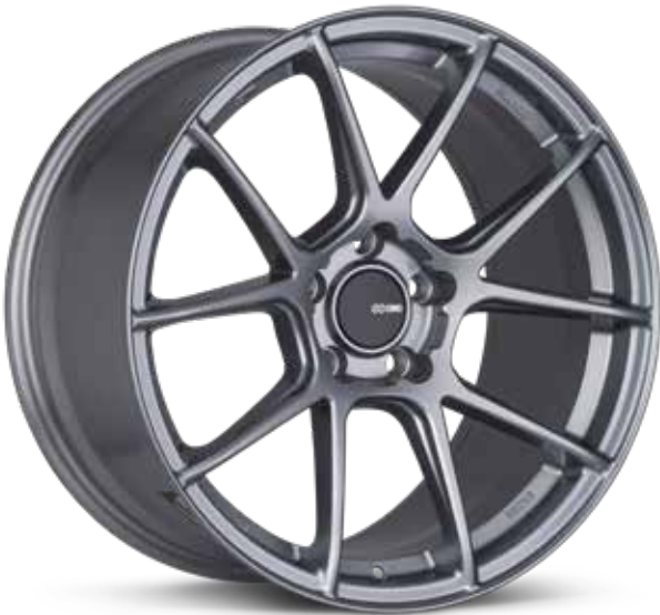
Storm Gray (GR)