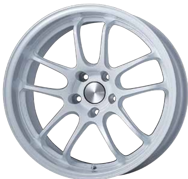
Pearl White (WP)