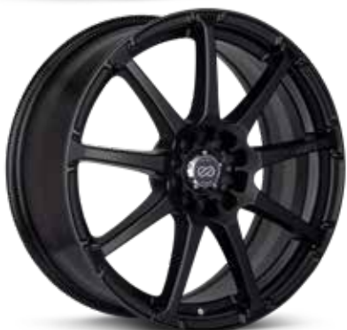
Matte Black (BK)