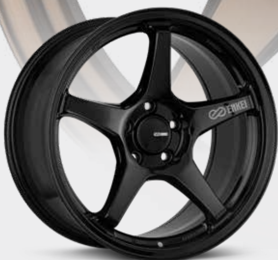
Gloss Black (BK)