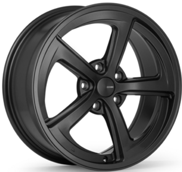
Gloss Light Gunmetal (GM)

Voici la série Performance d'Enkei. La série Performance d'Enkei représente la meilleure combinaison de style, de performance et de valeur sur le marché des jantes de rechange aujourd'hui. L'expertise en ingénierie et la fabrication de classe mondiale d'Enkei nous permettent d'offrir des jantes de haute qualité dans une large gamme d'applications de véhicules sans se ruiner.