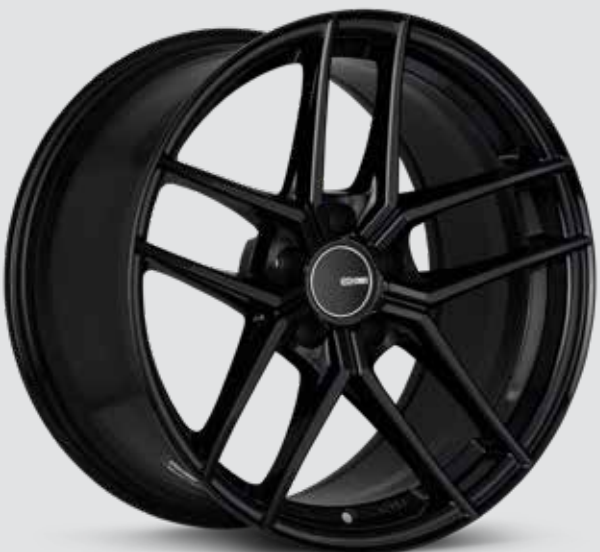
Gloss Black (BK)