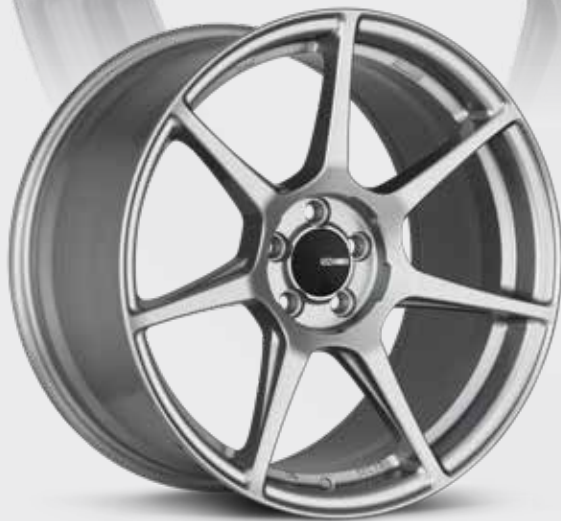
Storm Gray (GR)

Simplifier et apporter de la légèreté – c'est l'approche adoptée par Enkei avec la roue TFR de la série de personnalisation. Sept rayons aux contours parfaits partent d'un centre aux découpes soigneusement placées pour réduire le poids autant que possible. Avec la TFR, vous pouvez faire de l'autocross la fin de semaine et vous rendre au travail la semaine. Elle est vraiment polyvalente. La TFR est offerte en modèles de 17, 18 et 19 po avec des finis cuivre, gris tempête et bronze industriel. Le look se complète avec le chapeau de roue central plat caractéristique d'Enkei.