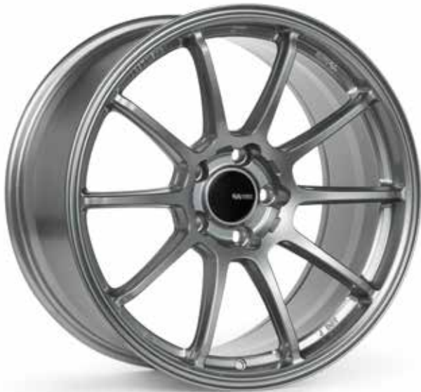
Storm Gray (GR)