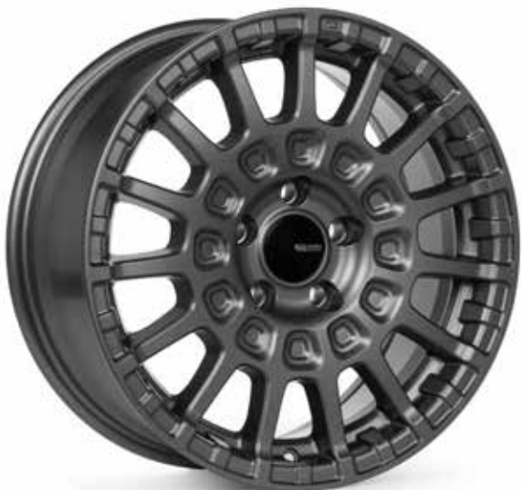
Matte Gunmetal (GM) (Special Order)