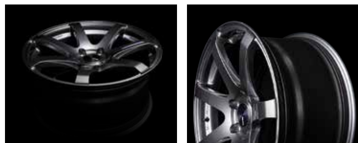
Dark Silver (DS)

Sept rayons d'allure dynamique s'étirent vers le rebord de la jante et créant une forme concave pour donner à la roue une profondeur supplémentaire et l'impression d'être une taille supérieure. Les côtés des rayons sont amincis pour les rendre plus légers tout en soulignant la forme concave. Le tout est associé à un rebord à double lèvre pour un look particulièrement agressif. Les concepts de la robustesse et du sport servent d'inspiration pour ces caractéristiques de conception. La jante de la roue est formée avec la technologie MAT pour atteindre un haut niveau de résistance, de rigidité et de légèreté. La face est conçue pour permettre l'installation d'un grand étrier de frein et pour améliorer les performances de refroidissement des freins lors de la conduite à grande vitesse.