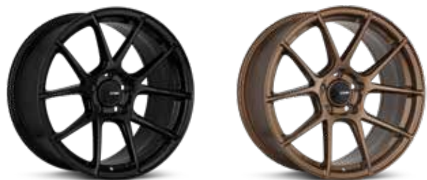
Gloss Black (BK)