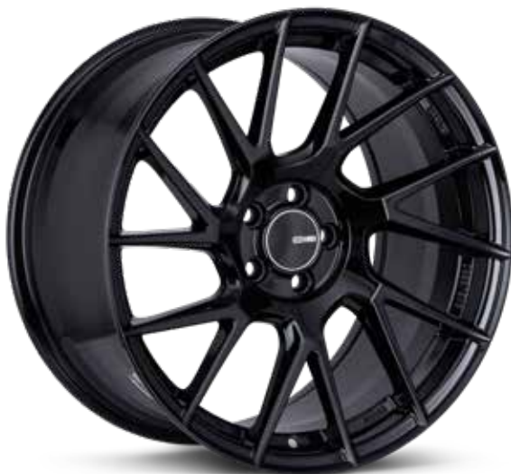
Gloss Black (BK)