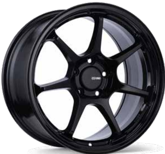
Gloss Black (BK)