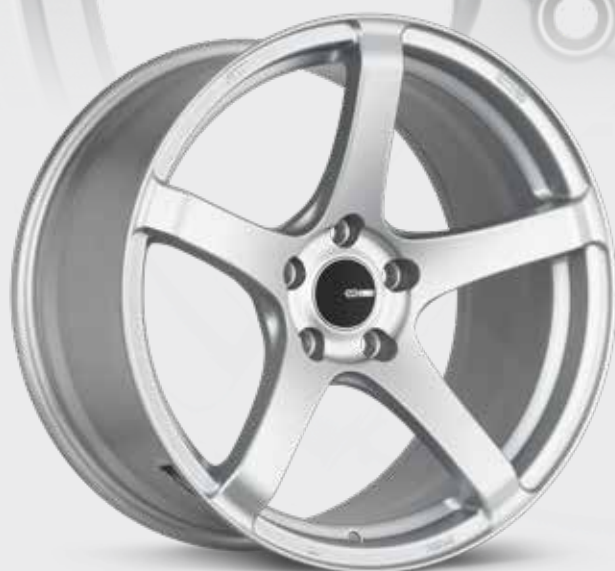
Matte Silver (SP)

La KOJIN reprend le design traditionnel à cinq rayons et y ajoute les contours adéquats pour lui donner un look personnalisé agressif sans en faire trop. La KOJIN est fabriquée à l'aide de la technologie MAT originale d'Enkei pour atteindre le summum de la résistance et de la légèreté. La KOJIN d'Enkei conjugue l'art et la science pour créer la prochaine grande avancée en matière de roues.