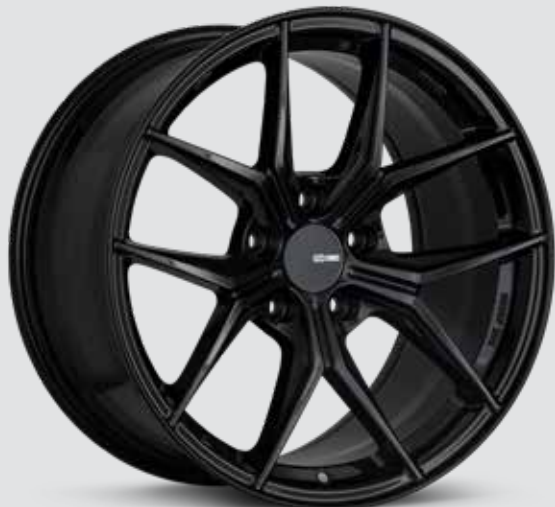
Gloss Black (BK)