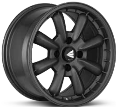
Matte Gunmetal (GM)