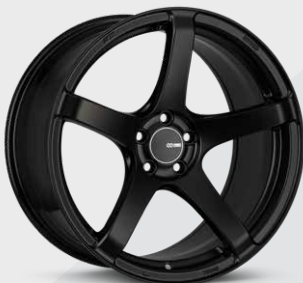
Matte Black (BK)