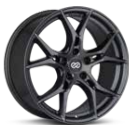
Gloss Anthracite (AP)