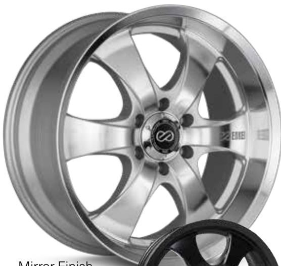
Mirror Finish (MF)