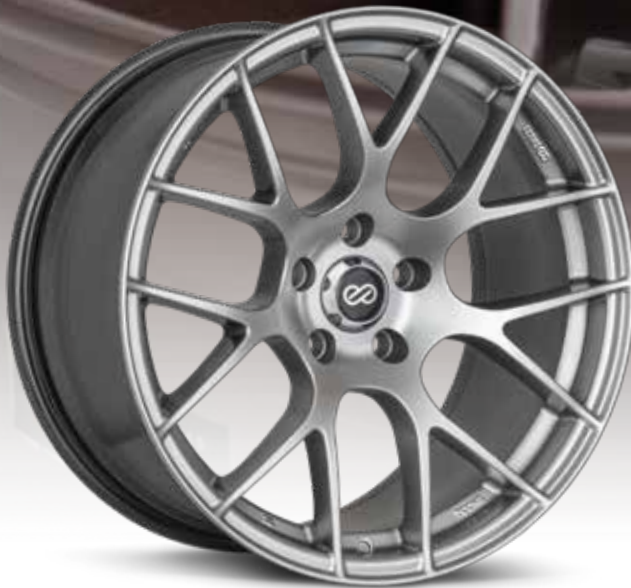
Hyper Silver (HS)