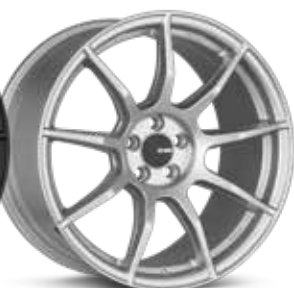
Matte Silver (SP)