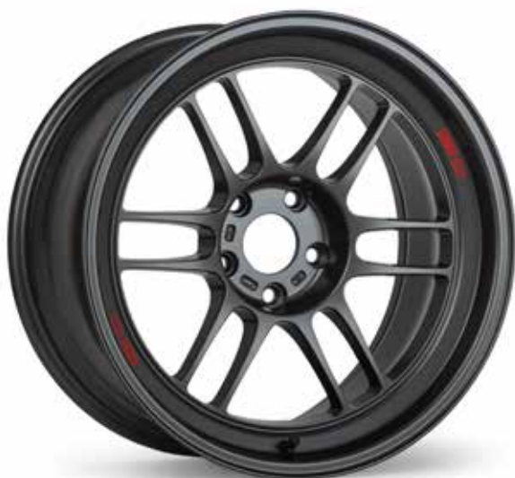
Dark Gunmetal (GM)