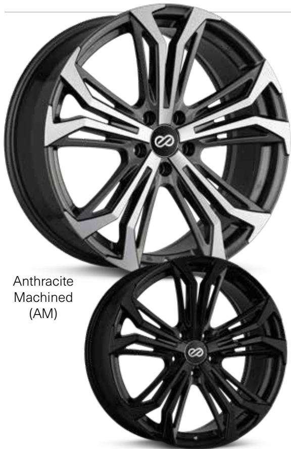
Anthracite Machined (AM)